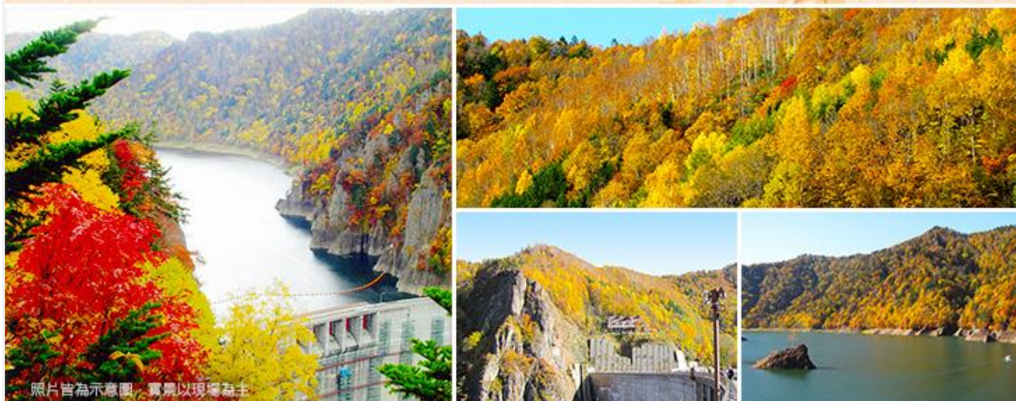
照片皆為示意圖，實景以現場為主

是從定山溪溫泉沿著豐平川溯流而上約7km的拱形水壩。原生林和柱狀節理的溪谷環繞，一年四季的風景皆不同。春天在鳥語花香，夏天浸在青山綠野中，秋天更是賞楓的名所，冬天雪景則像在雪地中挖一個溫泉洞般的感動。